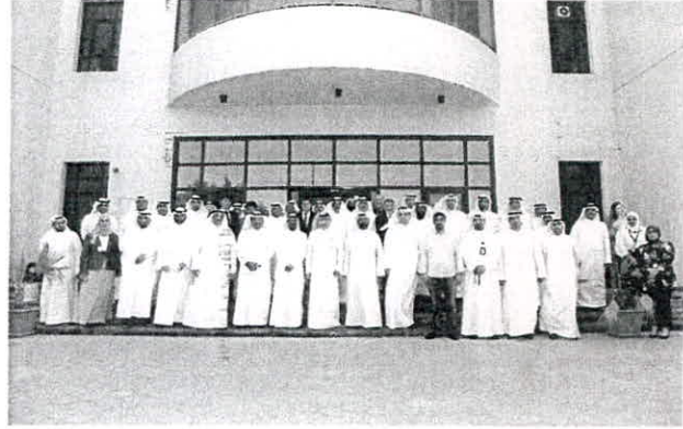
صورة جماعية لجميع المشاركين