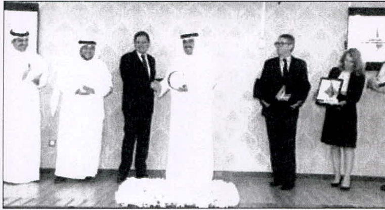
ممثل أكاديمية باريس يكرم المضف